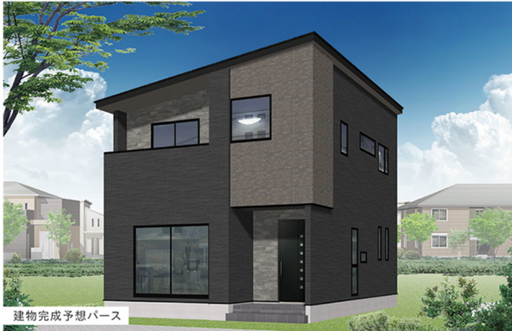
建物完成予想パース